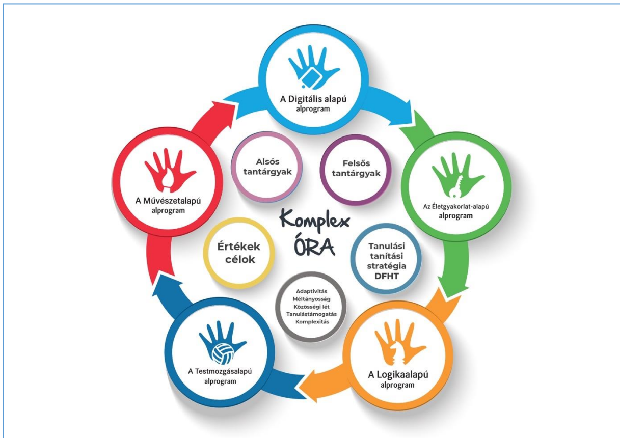
A Komplex órák felépítése