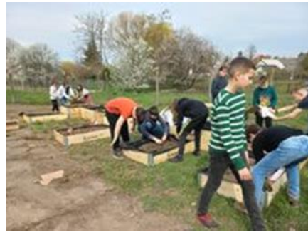
Víz világnapja; Fenntarthatósági témahét-2023; Húsmentes-nap