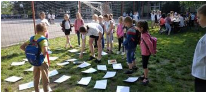
Séf the world-2023